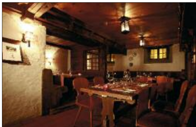
Impressionen vom legendären Hotel «Olden» in Gstaad, dem Treffpunkt der internationalen Gästeschaft im Nobelkurort im Saanenland.

Wenn es einen gesellschaftlichen «Place to go» im Prominenten-Dorf Gstaad ausserhalb der Luxus- und Fünfsterhotellerie gibt, dann ist das unbestritten das seit 1690 bestehende ehemalige «Wirtshaus Pinte», das 1895 mit acht andern Häusern einem grossen Dorfbrand zum Opfer fiel und später als Stein- und Wirtshaus wieder aufgebaut wurde. Heute kennt man das markante Gebäude mit den handbemalten Fassaden als Hotel «Olden». Hier trifft sich «tout Gstaad».